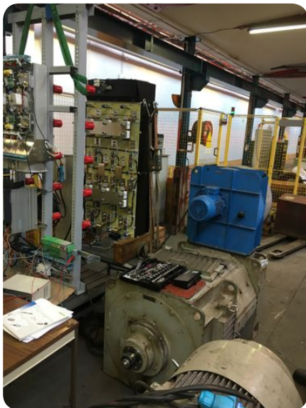
Rénovation de l'alimentation électrique de la machine Joseph (à gauche) et réparations d'urgence sur la machine Else (à droite), qui réclame des travaux plus importants.

Le moteur de la machine Else, dont le groupe d'alimentation a subi une casse irréparable en mai dernier, a été expertisé et des réparations d'urgence ont été réalisées. Pour fiabiliser la machine jusqu'à la fin des travaux de fermeture, des réparations lourdes seront nécessaires. Un appel d'offres européen a été engagé pour ce marché de gros travaux qui devraient être réalisés en 2018.